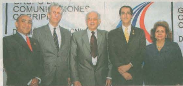
Directivos de los rotarios en la República Dominicana.

En sus 65 años de presencia en la República Dominicana el Club Rotario Internacional ha tenido un particular desvelo y servicio a favor de la salud y la educación de los grupos sociales con más necesidades. ○ PÁGINAS 16 Y 17