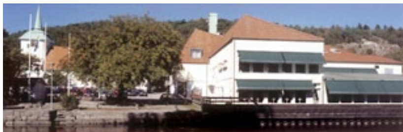
Hotell Fars Hatt. Rotarys hemvist i Kungälv