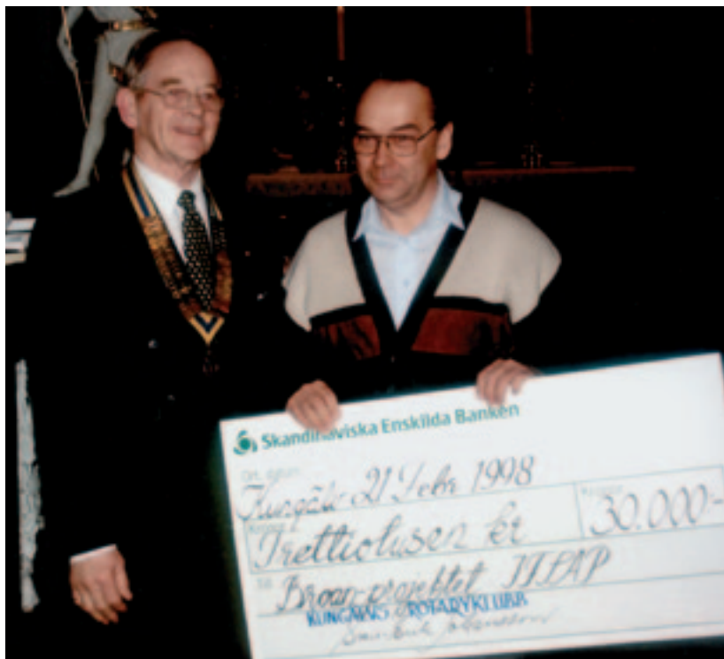
Broanprojektet får sin check