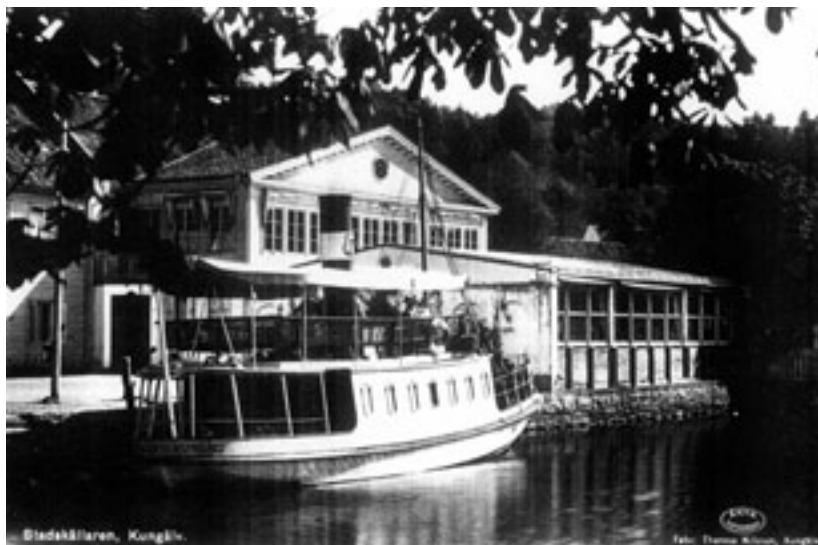
Stadskällaren före branden

Dåförtiden gällde en något annorlunda mötesritual; föredraget inledde kvällens begivenheter varefter snapsbrickan bjöds omkring, lika naturligt som att måltiden avslutades med att den kalla punschen kom på bordet; inte heller var det ovanligt att kvällens diskussion fortsatte hemma hos någon av rotarianerna.