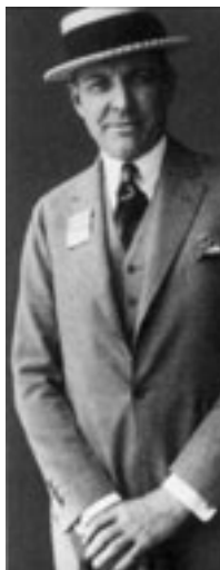
Arch C. Klumph, Rotarys sjätte president, startade RotaryFoundation

Rotarianerna i Kungälv tillhör som alla andra rotarianer i världen den stora internationella rörelsen, Rotary International . Denna sköna och svindlande tanke tränger sig förvisso inte alltid på vid de trivsamma veckomötena. Men det framgår dock med full evidens när man årgång för årgång går igenom de löpande veckoprogrammen, att det internationella perspektivet finns i klubben som en kraftfull underström, som från starten inspirerat medlemmarna till olika aktiviteter. Att den enskilda klubben är en integrerad del av något större blir snart en nyvorden rotarian medveten om, när Rotarymatrikeln för första gången hamnar i hans/hennes hand. Förr kunde man också känna den internationella pulsen då standaren exponerades. Besök i andra klubbar – icke att förglömma – liksom besök av gästande rotarianer i den egna klubben ger en aning om det nätverk som rotaryrörelsen är.