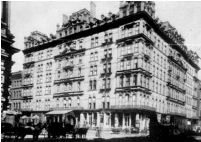
Sherman House 1906, Rotarys första mötesplats

perspektivet se, hur den speciella rotaryanda som Paul Harris skapade redan från början, har fortplantat sig över världen och levt vidare.