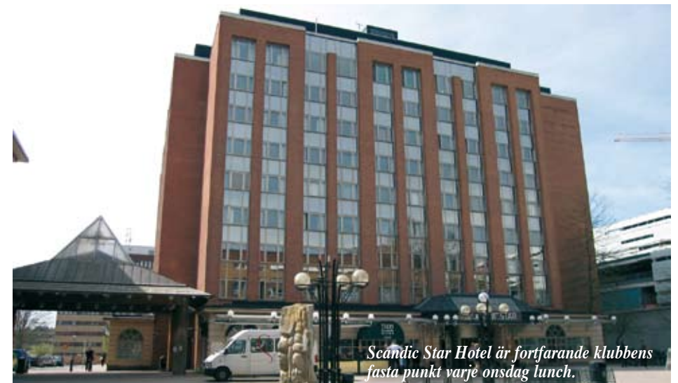
Scandic Star Hotel är fortfarande klubbens fasta punkt varje onsdag lunch.