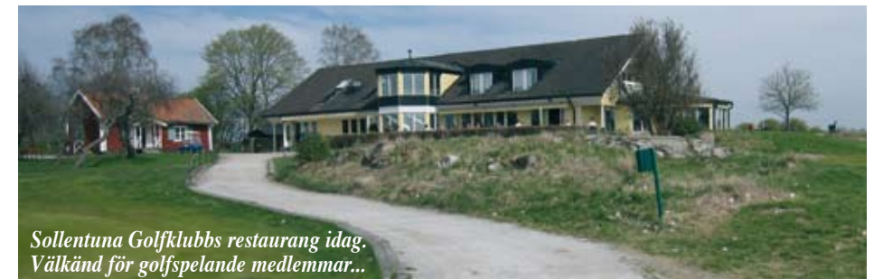
Sollentuna Golfklubbens restaurang idag. Välkänd för golfspelande medlemmar...