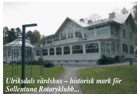
Ulriksdals värdshus – historisk mark för Sollentuna Rotaryklubb...

Vid sidan av lunchmötena roade sig klubbmedlemmarna både med varandra och sina